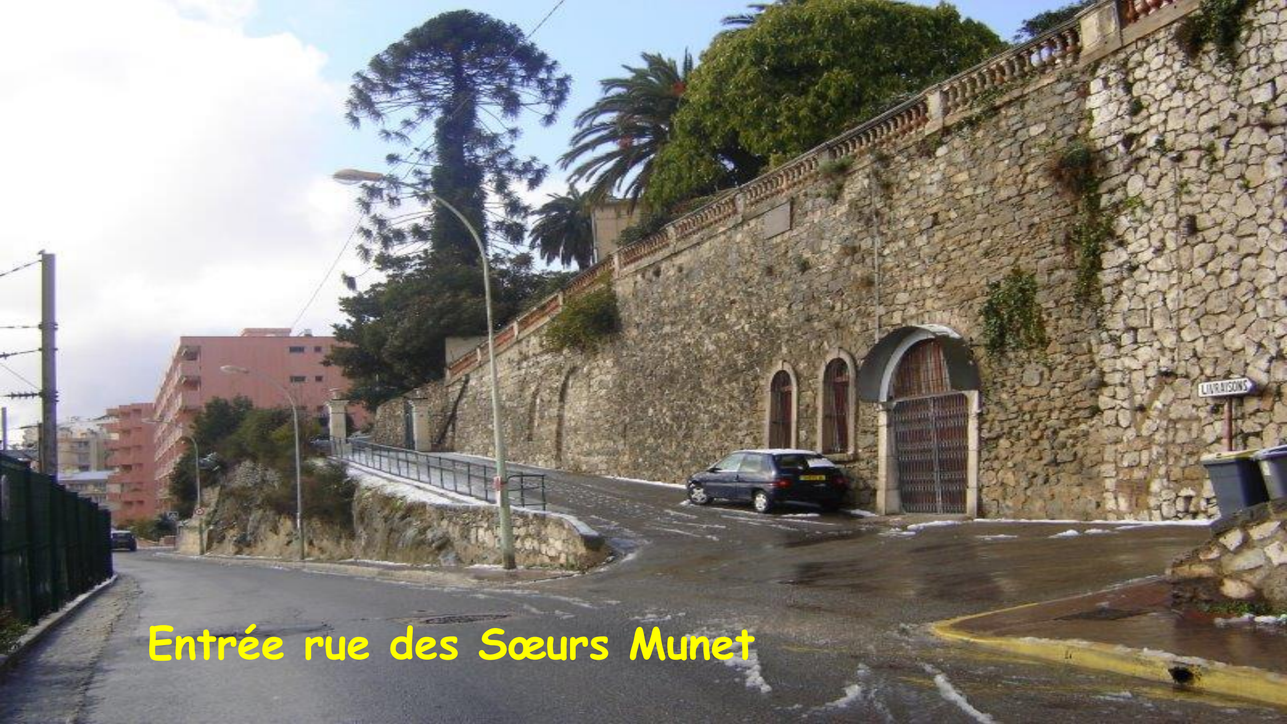
Entrée rue des Sœurs Munet