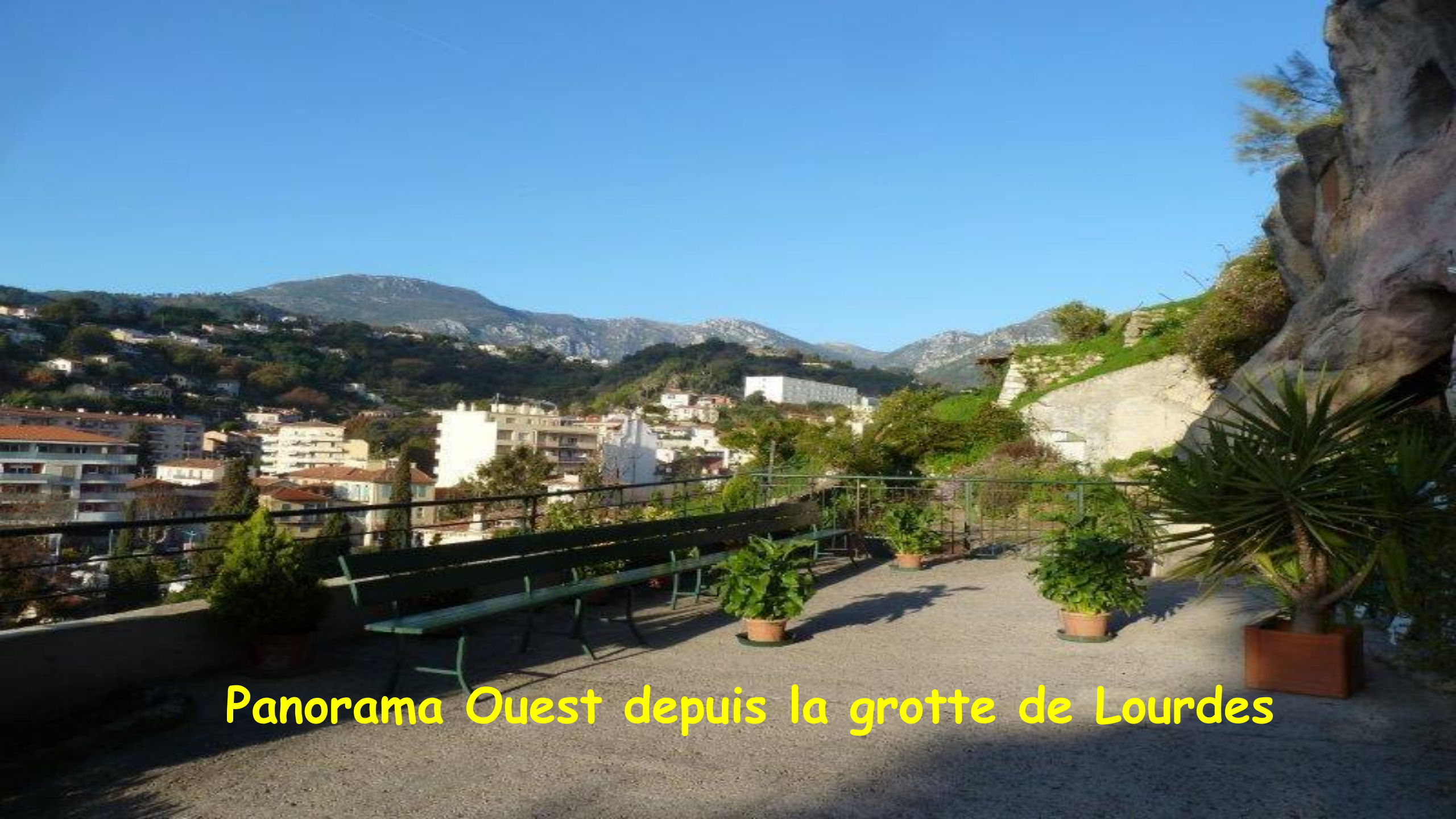
Panorama Ouest depuis la grotte de Lourdes