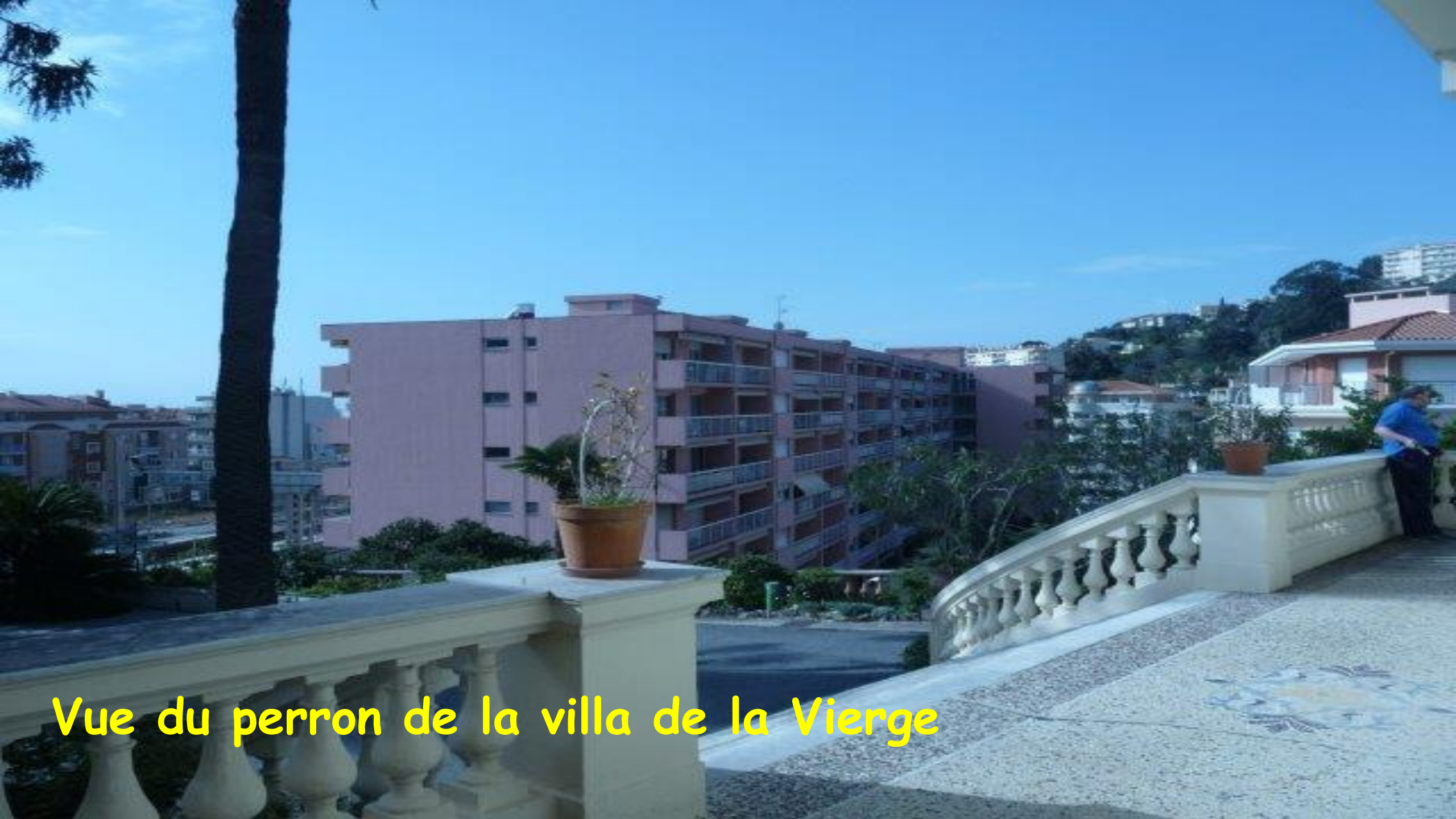
Vue du perron de la villa de la Vierge