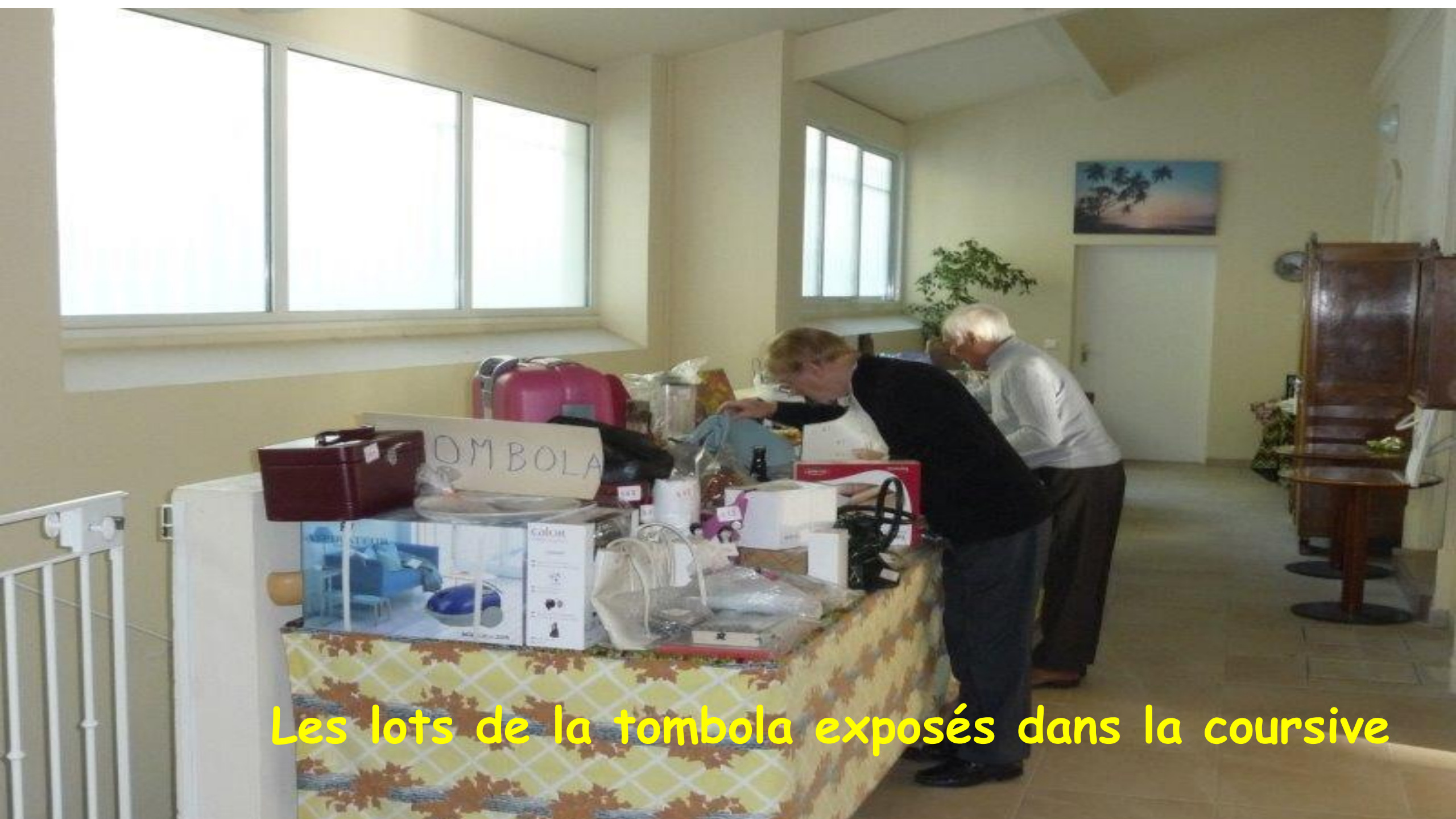
Les lots de la tombola exposés dans la coursive