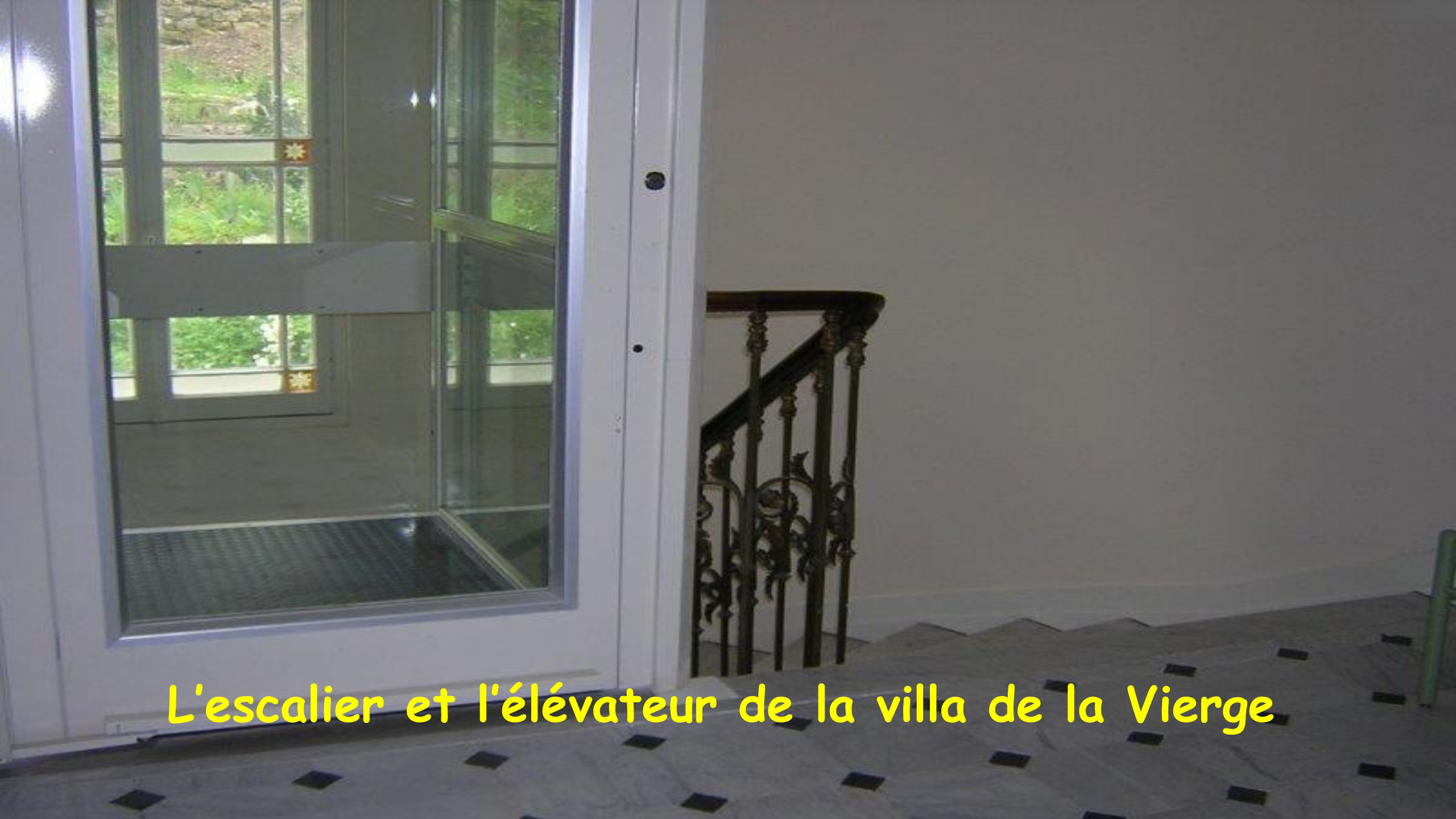
L'escalier et l'élévateur de la villa de la Vierge