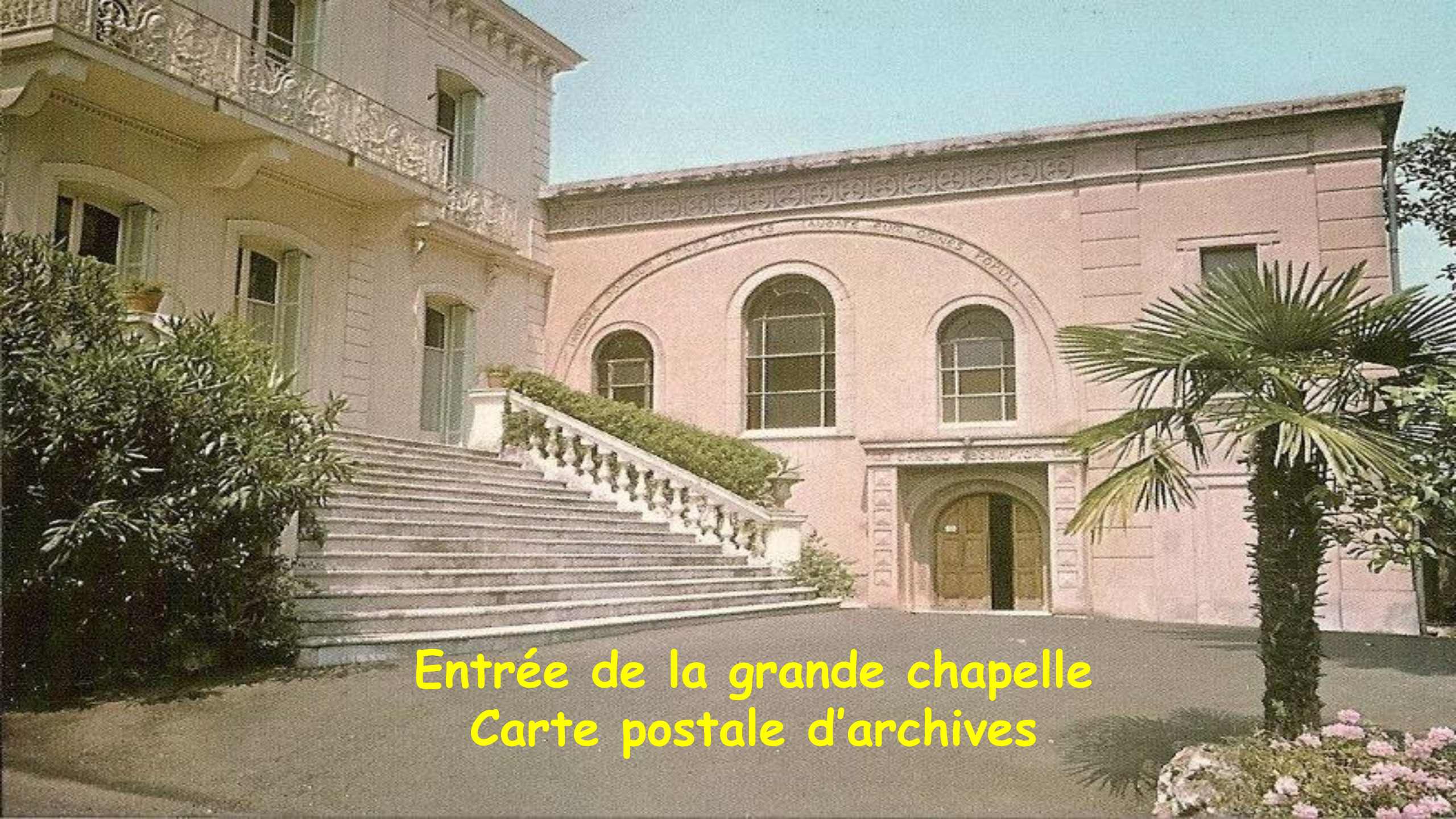
Entrée de la grande chapelle Carte postale d'archives