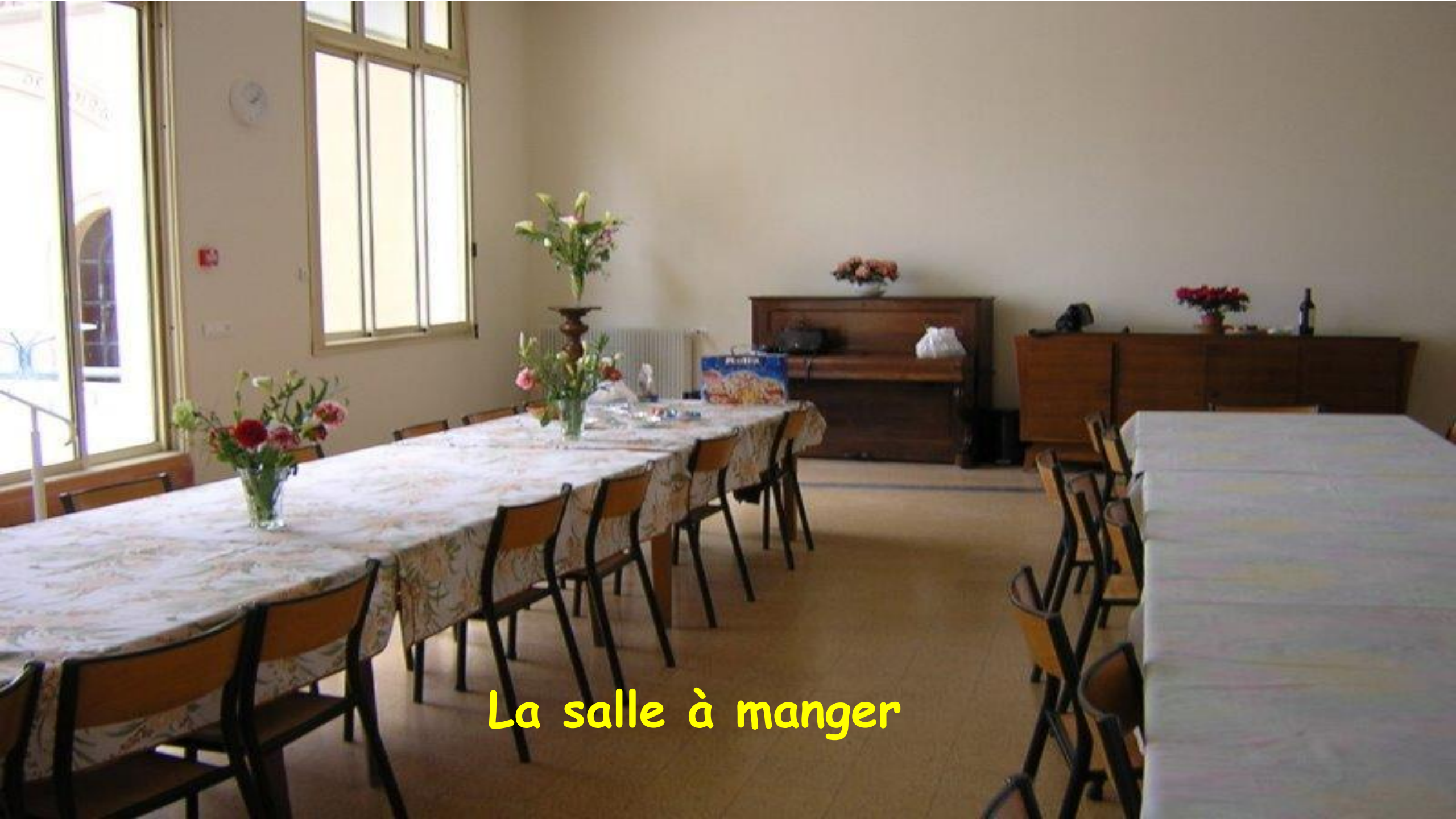
La salle à manger