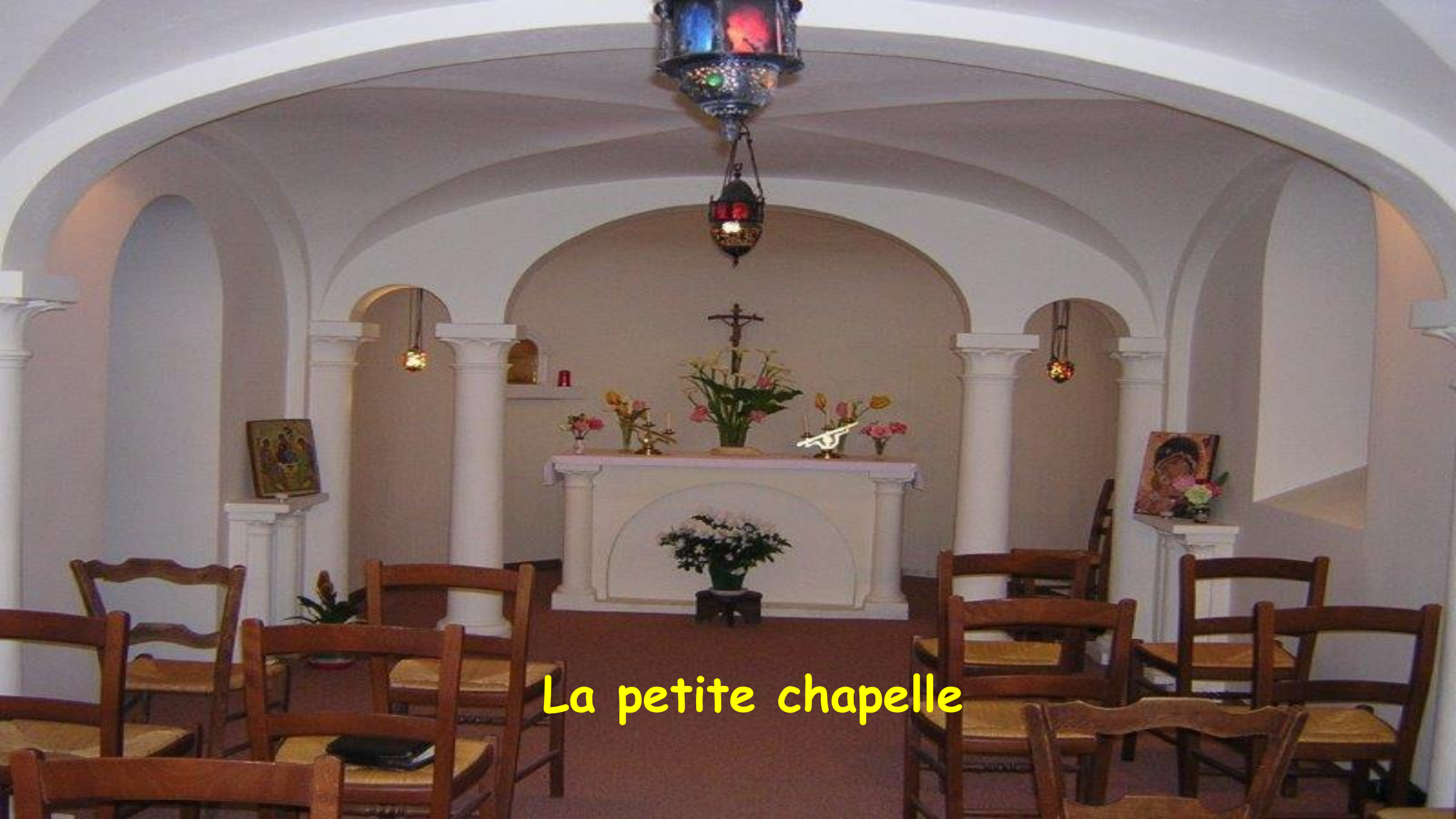
La petite chapelle