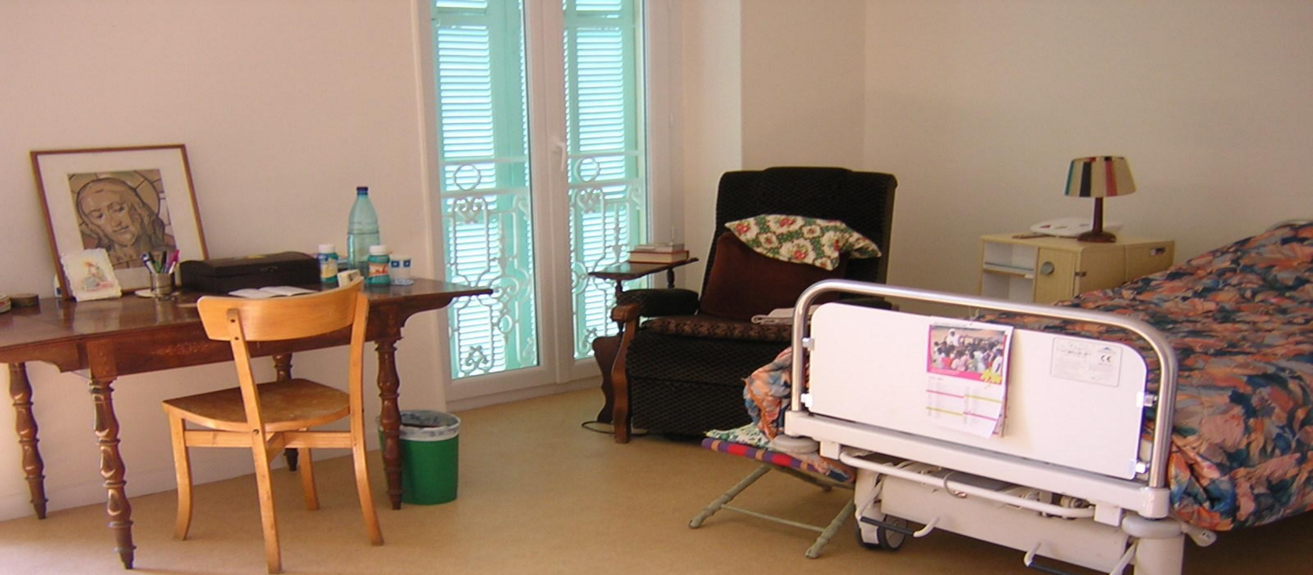
Une de huit chambres médicalisées destinées aux sœurs âgées