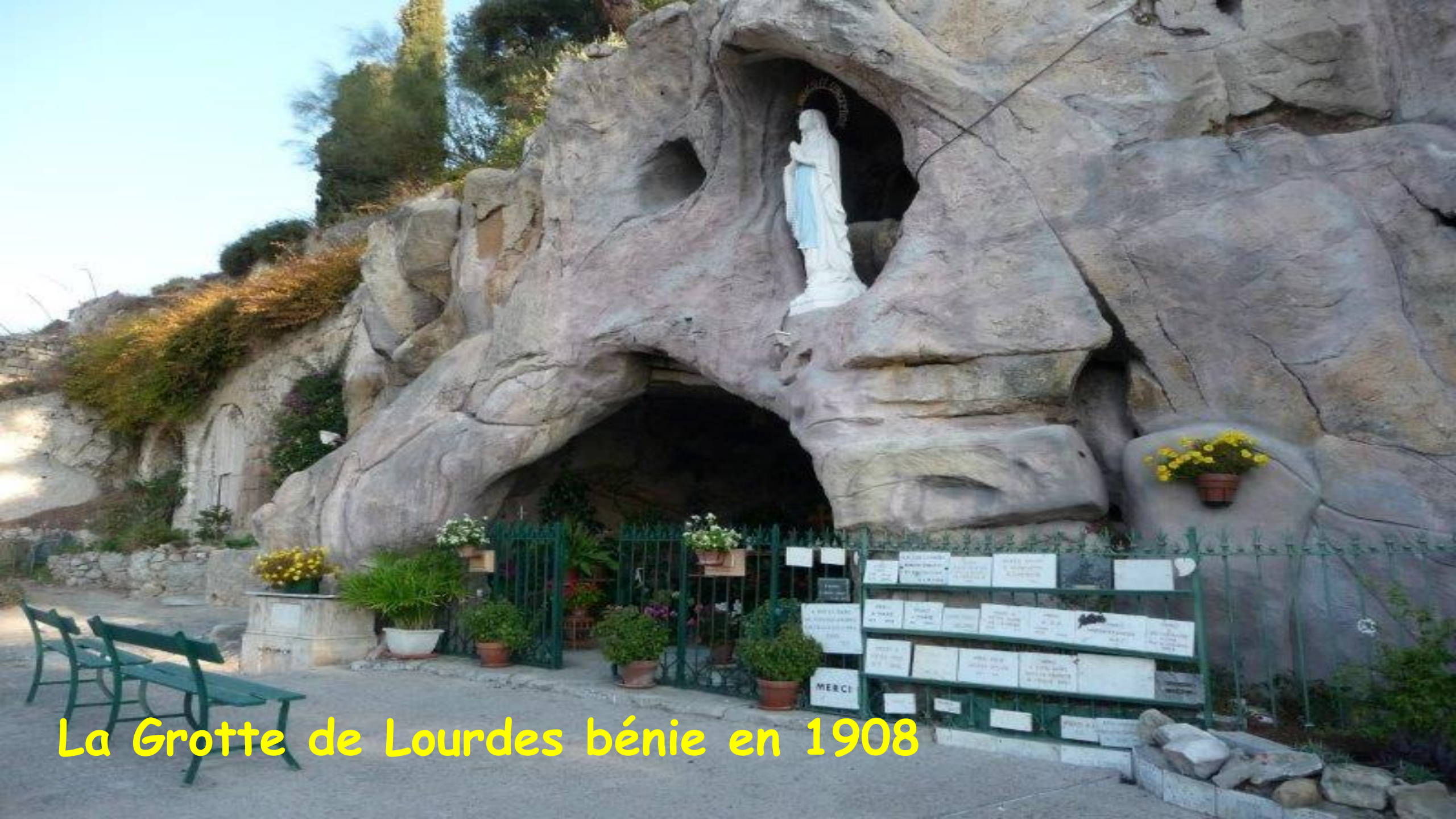
La Grotte de Lourdes bénie en 1908