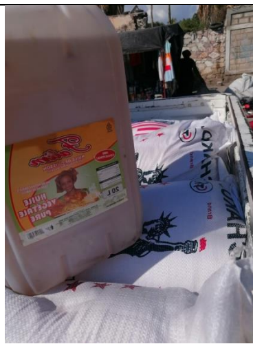
Huile végétale venant d'Indonésie