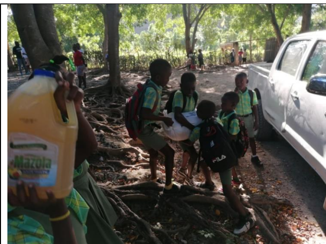
Les enfants qui déchargent la voiture, sont des enfants de l'école de Garcin.